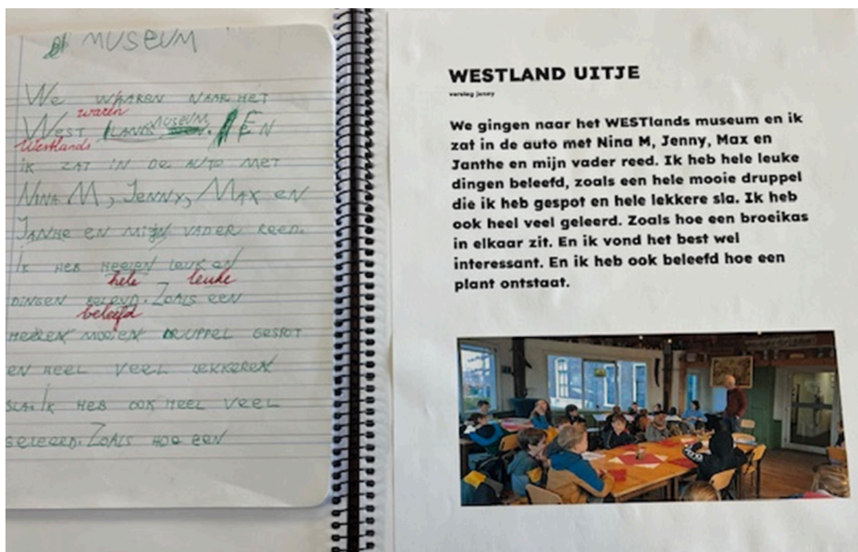
Vrije tekst en de verbeterde versie na de tekstbespreking.

Voor een aantal kinderen van de Freinetschool Delft is de Nederlandse taal niet de eerste of de enige taal die ze leren. Wij bieden die leerlingen naast het reguliere aanbod NT-2 (Nederlands als tweede taal) begeleiding. Daarover leest u meer onder het kopje "Onderwijs op maat".